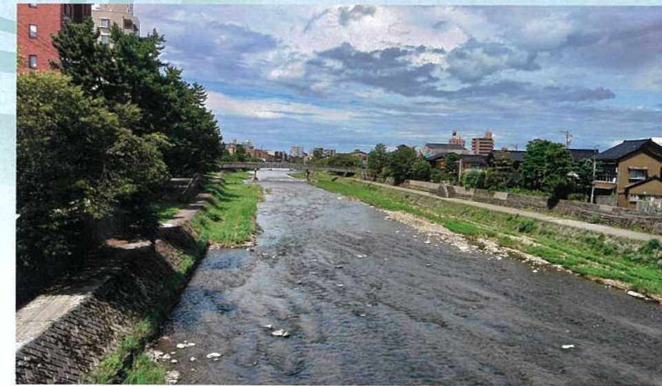
天神橋からの浅野川

主催:浅野川笹流し実行委員会 毎年7月7日前後の土日に開催されます。浅野川周辺の住民が作った七夕飾りと、子どもたちが作った飾りを持ち寄り流します。子どもたちは夕方6時になると七夕飾りをつけた笹を持って町内を「七夕行列」で練り歩き、最後に梅の橋に集まり、橋の上から浅野川に七夕飾りを笹ごと投げ入れます。短冊に書いた願いを浅野川の流れが叶えてくれるという言い伝えによるものです。